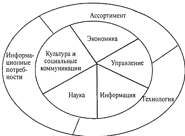
Рис. 1. Схема сфер влияния в процессе отбора документов в академической библиотеке

в фонд академической библиотеки должны учитывать изменения и тенденции в различных сферах деятельности и отражаться в технологических операциях процесса комплектования (рис. 1).