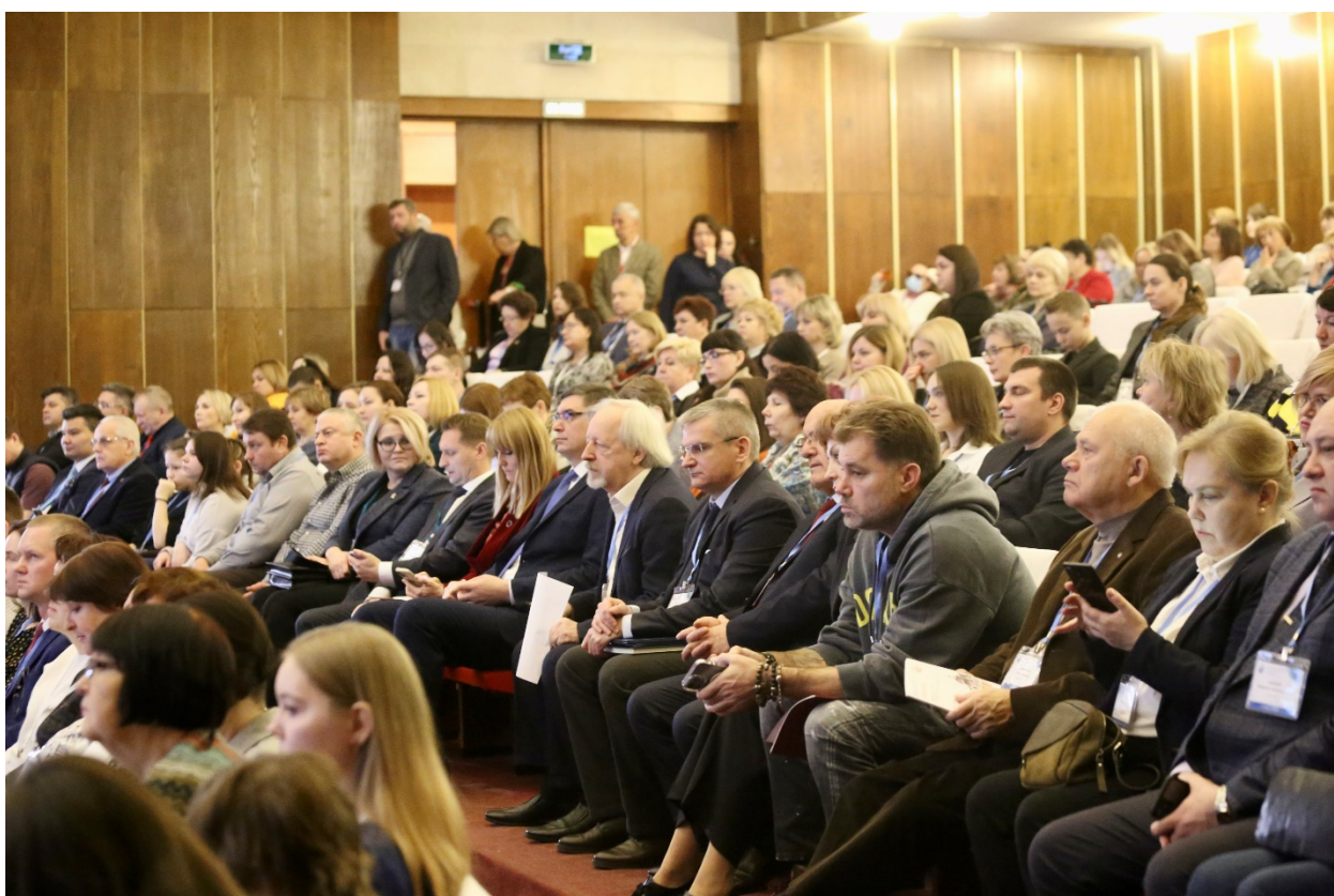
Открытие конференции. Приветствия и пленарное заседание

С УВАЖЕНИЕМ, ОТДЕЛ НАУКОМЕТРИЧЕСКИХ ИССЛЕДОВАНИЙ БЕН РАН.